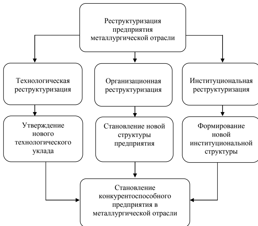
Рис. 1. Составные элементы, обеспечивающие реструктуризацию предприятий в металлургии

(Constituent elements, to ensure enter-prize restructuring in the steel industry)