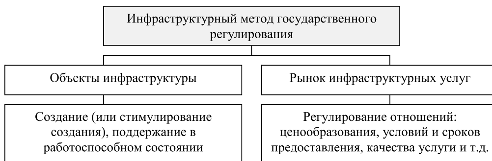
Рис.2. Содержание инфраструктурного метода государственного регулирования

Инфраструктурный метод государственного регулирования направлен на создание объектов инфраструктуры и регулирование рынка инфраструктурных услуг с целью обеспечения развития общества в целом и экономики в частности.