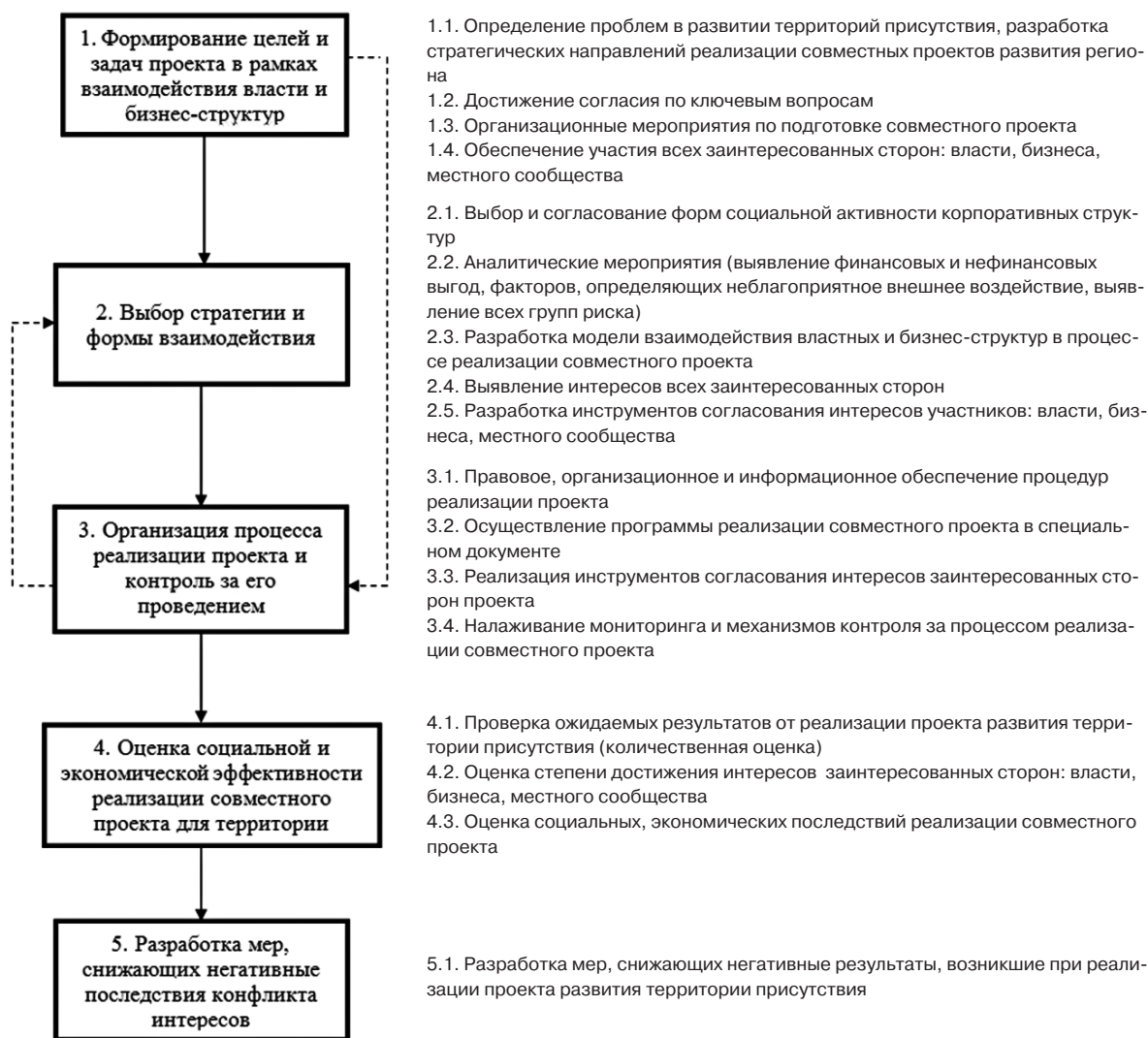
Рис. 3. Последовательность этапов реализации механизма согласования интересов власти и бизнеса при реализации совместных проектов на территории присутствия

[The sequence of stages of the coordination mechanism of interests between business and government in the implementation of joint projects in the presence]