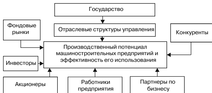
Рис. 1. Круг лиц и организаций, заинтересованных в оценке производственного потенциала машиностроительных предприятий

Использование второго подхода по оценке результатов деятельности предприятия также неоднозначно, поскольку, несмотря на то что достаточно просто определить фактические показатели предприятия за год (выручка, прибыль и т.д.), возникает вопрос о том, насколько полно использовалась производственная мощность.